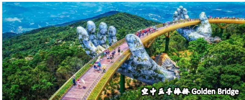
空中五手捧桥 Golden Bridge